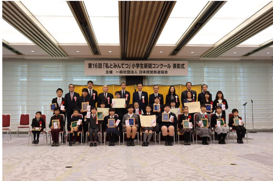
第16回新聞コンクール表彰式の様子（東京 経団連会館）