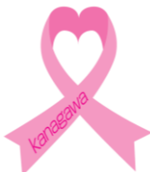
ピンクリボンかながわ ロゴマーク