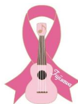
ピンクリボンふじさわ ロゴマーク