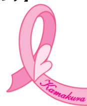
ピンクリボン鎌倉 ロゴマーク