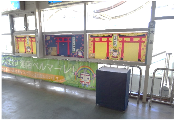
合格祈願神社実施例(大船駅Homeギャラリー)