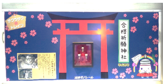
合格祈願神社御神体

実施内容 2016年6月26日に引退した500形551編成の安心安全な運行を27年間支えてきた台車と車体を締結するボルトを祀ります。また、紙製絵馬ふせんと記入台をご用意しておりますので、祈願される方には、合格祈願神社に無料で貼付いただけます。