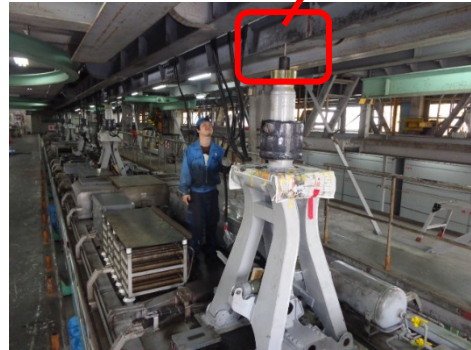
27年間台車と車体を締結していたボルト