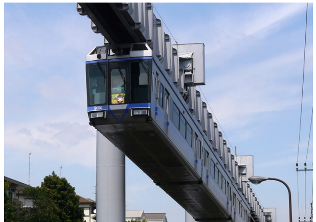
サクラサクトレイン5603編成(湘南ブルーライン) ※イメージです

実施内容 合格祈願仕様のヘッドマーク、 行先方向板を取付し運行いたします。 また車内には“合格祈願”メッセージの まど上ポスターを掲出し運行いたします。