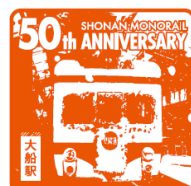
スタンプ(イメージ)