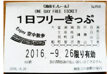
湘南モノレール1日フリーきっぷ