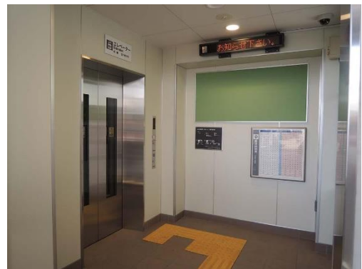
上りエレベーター